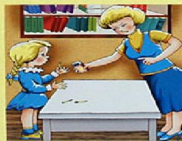
Не играй со спичками!