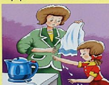
Не трогай провода электроприборов и сами электроприборы мокрыми руками!