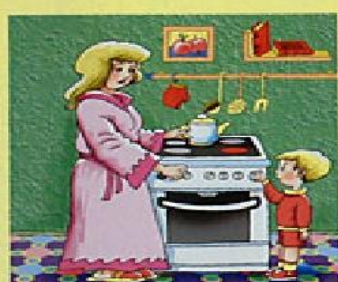
Пользуйся электроприборами только под присмотром взрослых!

Чтоб труд радость приносил, надо чтоб он безопасным был!.