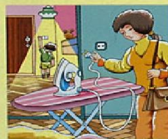
Уходя из дома, гаси свет и выключай электроприборы!