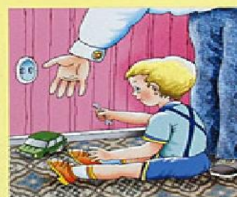
Не играй с розетками!