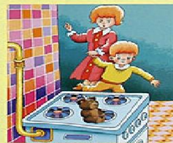
Не играй с газовой плитой!